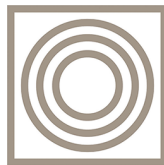
Table de cuisson multi-zones: flexibilité optimale

La minuterie Öko vous permet d'économiser de l'énergie en utilisant la chaleur résiduelle de la table de cuisson durant les dernières minutes du processus de cuisson.